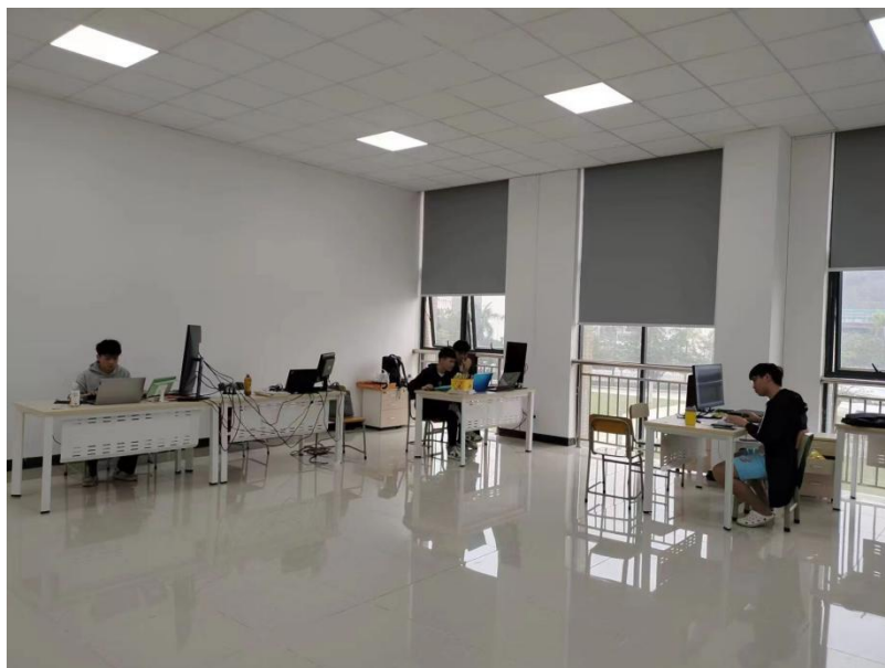
图 1-3 超星平台在线课程