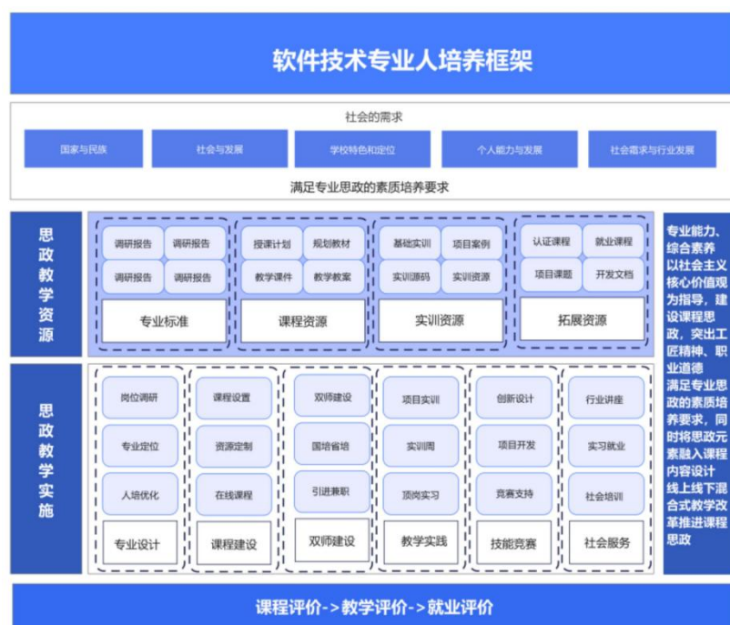
图 3-1 专业层贯穿思政教育的人才培养框架

从专业层面对思政教育进行整体设计，明确人才培养目标，修订人才培养方案、教学大纲，思政教学资源到思政教学实施全方位体现思政在专业领域里的内涵。