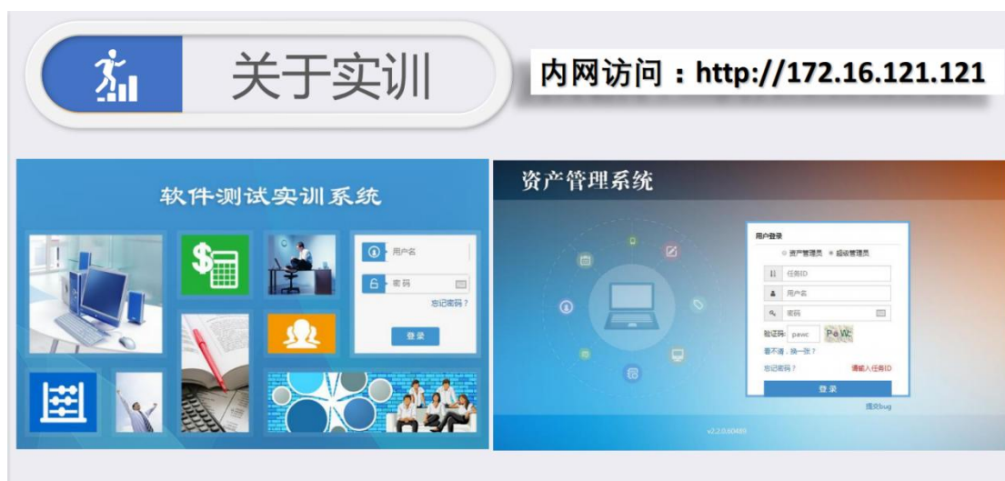
图 1-1 资产管理系统（功能测试、性能测试）软件

本课程配备资产管理系统（功能测试、性能测试）软件 1 套，建成软件测试实训室 1 间，建成软件——测试开发工作室，建立了超星平台在线课程。