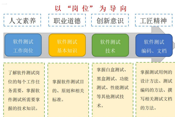
图 3-1 岗位导向图

业要求对接，最大限度匹配与适应企业用人需求，促进产教融合，有效培养学生实践能力。教学过程创新，采用教师主讲、精品课视频学习、小组讨论、学生展示等教学方式开展教学活动。教师讲解课程框架结构，阐述知识点，梳理知识关系，总结并引导探索。学生通过视频自主学习知识点，开展小组讨论。小组讨论遇到难以理解的问题、或小组成员能力相对较弱时，教师进行适当的提示和讲解，在循序渐进的教学活动中，使学生成为自主学习者。知识内容学习结束后，学生采用对分课堂方式总结，激发学习内驱力。