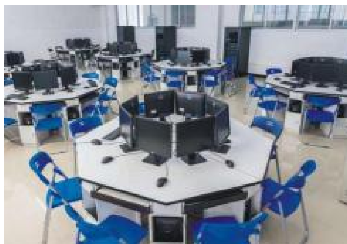
图 1-2 软件测试实训室