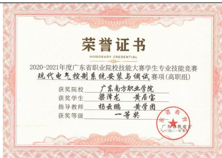
图 2 专业群师生在广东省职业院校技能大赛中获奖