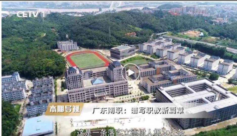
图 12 “魅力中国”对我校及专业群报道