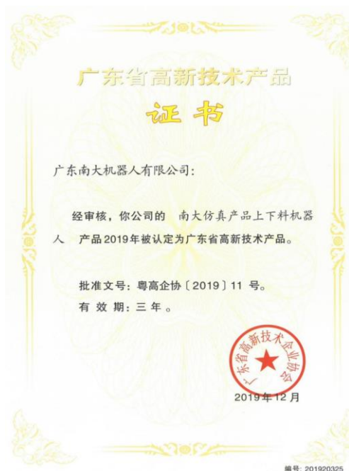
图 19 专业群教学团队与校办工厂一起研发高新产品

结合珠三角地区装备制造、机器人、汽车等产业发展，根据职业岗位的知识、能力和综合素质、综合知识要求，基于职业成长规律，坚持以“学生为本”，突出“就业、发展”为内涵的学做结合人才培养改革思想，将学做结合贯穿在人才培养全过程，强化职业道德教育和职业精神培养，提升学生的综合职业素质。参照职业岗位任职要求，构建“项目为导线、专业群知识为主线、一专多能”的课程体系，推行“专业群课程一体化”教学方式。