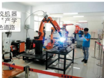
学生在南大机器人生产线上顶岗实习

全国最高水平的大学生机器人科技竞赛赛事上，江门高等院校突围而出！记者29日了解到，在近日举行的第十七届全国大学生机器人大赛 Robotac 组赛事中，来自江门的广东南方职业学院脱颖而出，顺利进入复赛，成为广东入围复赛的四强之一。据悉，江门高校机器人专业取得不俗的成绩，得益于近年来江门多家高校与相关企业的深度融合，部分校企还合作建立“校中厂”，走出了一条“产学研”结合的特色道路。