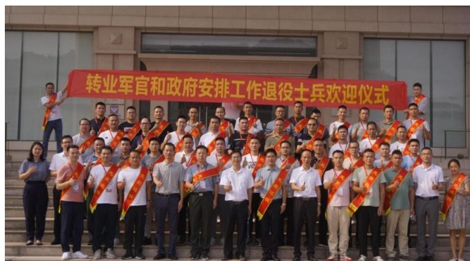
图 11 江门市“退役军人”工业机器人技术培训班

依托建成后的专业群优势、已有工业机器人技术龙头专业优势，及广东南方职业学院工业机器人技术专业群协同中心和智能制造专业群共享实训基地，积极开展对外培训、职业技能鉴定、对外技术服务等活动，打造了集“教学、生产、培训、科研及对外技术服务”等五位一体、管理先进、功能完备、辐射面广、资源共享的集群效应；辐射、带动区域经济发展和产业结构升级。