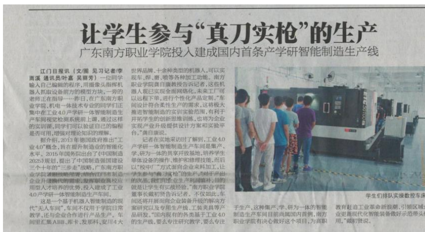
图 17 专业群学生参与生产实践

为深化人才培养模式改革，强化学生综合实习、实践能力，2019 年学校以校办工厂“广东南大机器人有限公司”和科技创新孵化基地为基础，创建“2018 级智能制造高端新型学徒制人才班”的培养模式，至今已创办 3 届，由校企双方为学生共同选派“双导师”，量身定制培养方案，针对学生兴趣所在制定毕业设计内容，打造创新人才培养平台，为企业培养技术性、应用型的一专多能综合性人才。