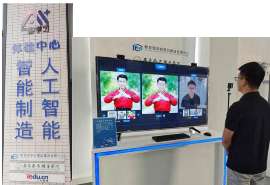
图4 智能制造“智慧学习”体验中心

专业群特色教法改革以深度产教融合的模式进行，第一阶段提出专业群内各专业对应装备制造产业所需通用教学的主要内容和要求，学习的知识点，第二阶段掌握本专业对应装备制造产业单独用到的知识点，以需求为导向，第三阶段，实施具体实践项目，学生掌握了各专业一定的知识，可以开展实践项目，掌握生产项目的主要技术，第四阶段，对还没有完成的部分知识点进行补充，关键知识点和核心技能的学习，第五阶段，对全部所学专业群内知识点整理、总结，深化产教融合。