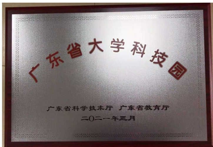
图 8 广东省大学科技园建成

工业机器人技术专业群立项建设以来，尤其是 2021、2022 年建设期间，始终将科技创新技术中心平台建设作为促进产教融合和创新融合的重要抓手，积极建立以学校为主体、市场为导向、专业群对应产业为切入点，并集聚技术创新、成果转化、技术服务、人才培养等为一体，具有较高水平的科技创新平台。截至目前，依托专业群建有广东南方职业学院“省大学科技园”1家，“广东省大学科技园与智能制造产教融合创新平台”获 2022 年度普通高校重点科研平台立项。