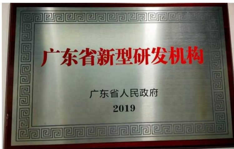
图 18 广东南大机器人公司-省新型研发机构牌匾

把真实企业办到学校(校中厂)、把教学教室搬到工厂中(厂中校),让学生在真实的工作环境中学习,使学生的知识技能与相应的工作岗位真正做到立足于专业群,而非某个专业,实现院校、企业、学生的三方共赢效果。