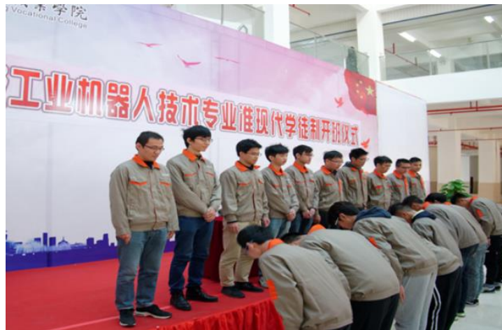
图3 专业群现代学徒制开班仪式