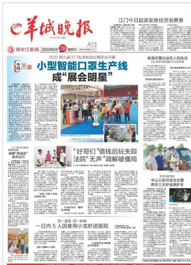
图 13 《羊城晚报》A13 版头条报道我校口罩生产线（智能控制专业）