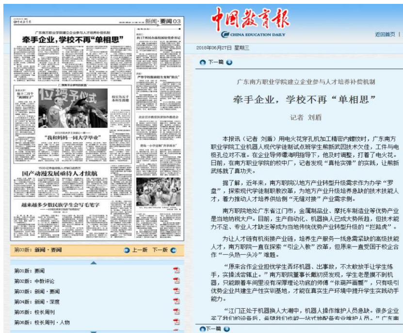
图 14 《中国教育报》报道我校校企合作办学特色