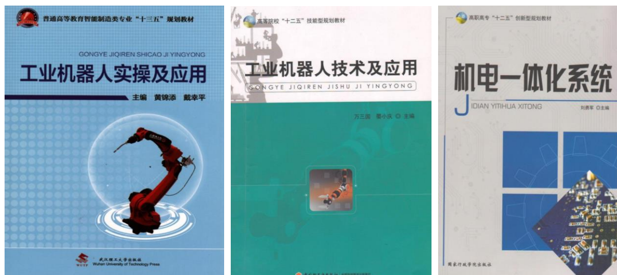
图5 专业群已编写的群内通用教材

专业群特色教法改革以深度产教融合的模式进行，第一阶段提出专业群内各专业对应装备制造产业所需通用教学的主要内容和要求，学习的知识点，第二阶段掌握本专业对应装备制造产业单独用到的知识点，以需求为导向，第三阶段，实施具体实践项目，学生掌握了各专业一定的知识，可以开展实践项目，掌握生产项目的主要技术，第四阶段，对还没有完成的部分知识点进行补充，关键知识点和核心技能的学习，第五阶段，对全部所学专业群内知识点整理、总结，深化产教融合。