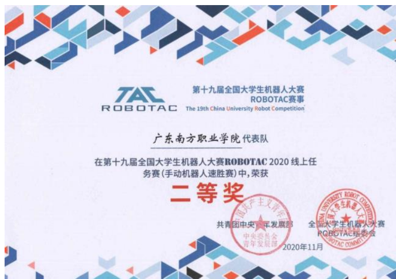
图1 专业群师生在全国大学生机器人大赛中获奖

依托专业群建设契机，不断推动1+X证书与“岗课赛证”改革，根据《广东省教育厅关于做好2020年1+X证书制度试点有关工作的通知》等文件精神，积极推进了工业机器人系统应用1+X证书试点，全面引进了北京赛育达公司成熟的1+X证书考评模式。基于职业岗位标准，融入技能竞赛标准，促进“课赛”融通；优化课程教学资源，融入改革后的职业技能等级证书标准，增强课程的职业适应性，促进“课证”融通。