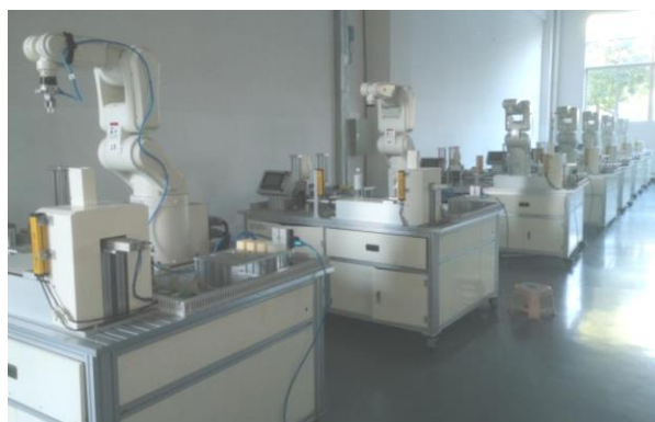
图7 1+X工业机器人操作与运维职业技能等级证书鉴定点