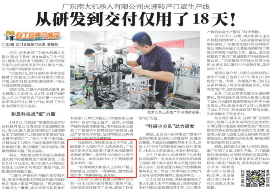
图 15 《江门日报》整版报道我校校办工厂口罩机研发（机电一体化专业）