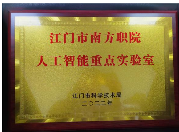
图 9 江门市“人工智能”重点实验室

建有市级重点技术中心和实验室 4 家，分别是江门市智能制造装备工程技术研究中心、江门市物联网远程数字控制工程技术研究中心、江门市 5G+智能制造产学研公共服务平台、江门市南方职院人工智能重点实验室，通过大力推进科技创新技术平台建设，对加快专业群创新建设、提升育人质量升级发挥了至关重要的作用。