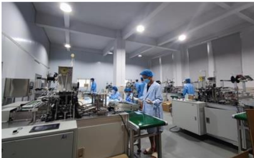
图6 专业群教师参与口罩机研发

组织教师积极参加行业企业新知识和技能提升培训，更新知识结构。工业机器人、机械、数控车床理论与实践教学培训是我校工业机器人技术高水平专业群 2021、2022 建设期内专业教师培训的重要内容。培训内容具有针对性，培训过程注重实践性、综合性，培训方式着重多元性，为工业机器人技术高水平专业群的发展做好人才储备。