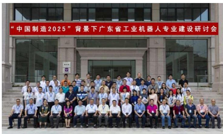
图 10 “中国制造 2025”广东省工业机器人专业建设研讨会在我校举办

专业群在校企合作体制机制创新、人才培养模式与课程体系改革、师资队伍建设、实验实训条件建设、社会服务能力提升等方面，结合区域经济社会发展需要，通过探索改革，获得一批具有智能制造专业特色、丰富多样的建设成果，势必会给地区装备制造产业提供发展思路，也带动校内其他专业的建设与发展，整体提升学校的专业建设水平、育人能力和办学社会影响力。